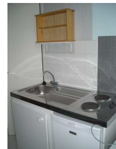
Cuisinette neuve (2010) avec frigo intégré