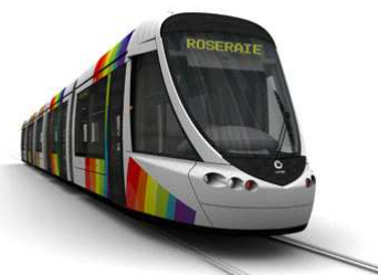
Ligne Tram dans la rue adjacente Station " Saint Serge Université "