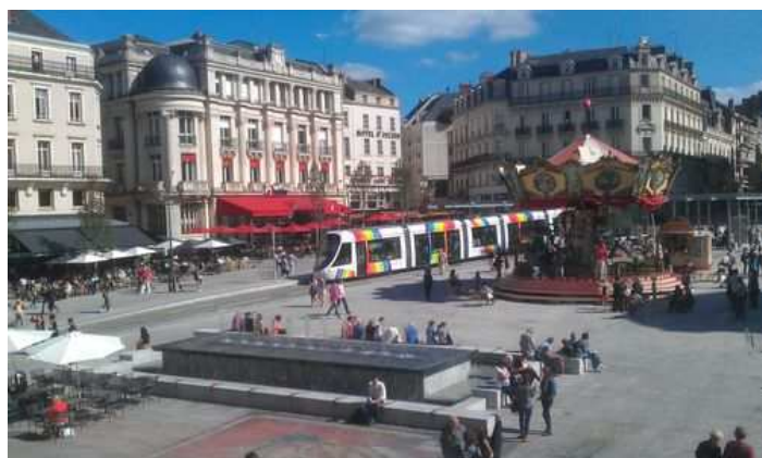
A 4 minutes à pied du "cœur" de la ville : la place du Ralliement , les cinémas, le Mc Do, ...